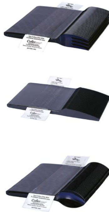
PAQUETS DE RECHARGE D'USTENSILES