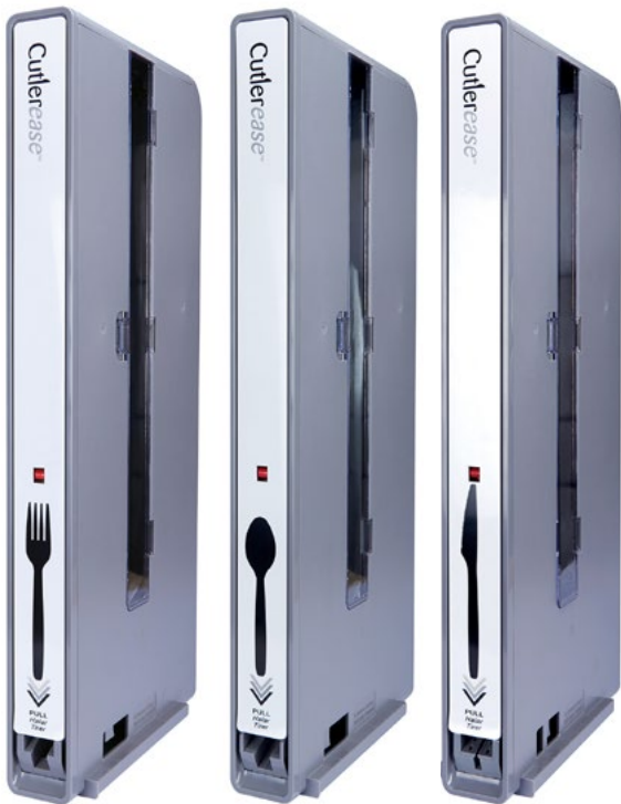
TOURS DU DISTRIBUTEUR